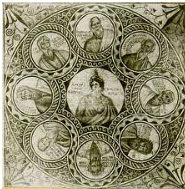
Die Muse Kalliope umgeben (gegen den Uhrzeiger) von Sokrates und den sieben Weisen - Solon, Thales, Bias von Priene, Kleoboulos, Periandros, Pittakos und Chilon. Mosaik aus dem späten dritten Jahrhundert n. Chr