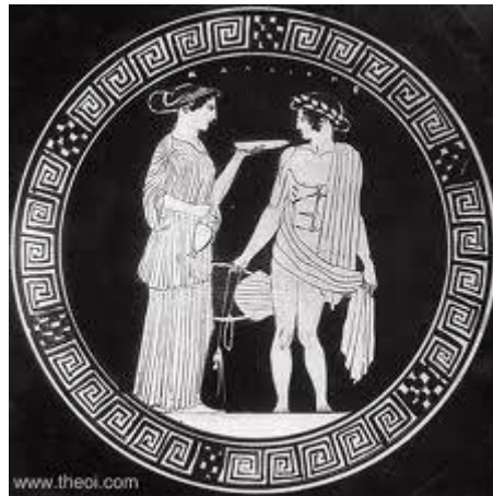
Kalliope und Apollon

Das Fest zum 7-jährigen Bestehen auf dem Parnassos „Auf den Spuren der Muse Kalliope“